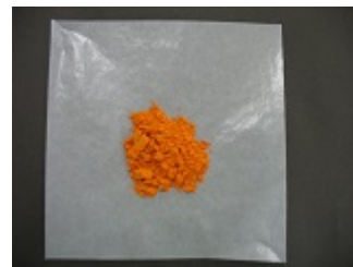
参考:天然物クルクミン

Na: 150ppb以下 K: 50ppb以下 Fe: 150ppb以下 Ca: 50ppb以下